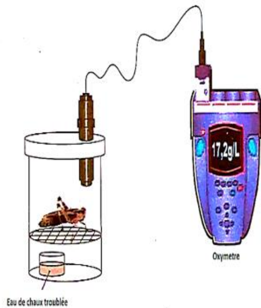
Fin de l'expérience